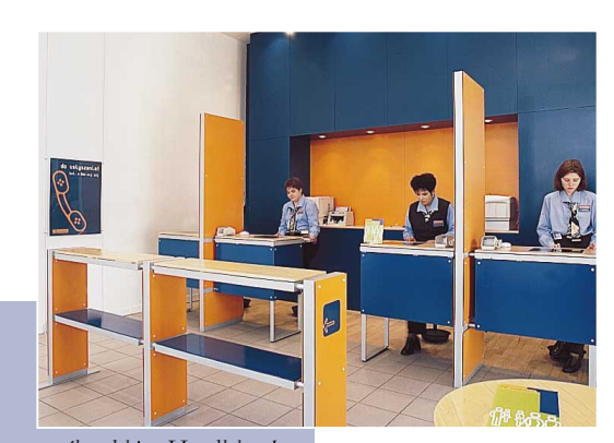
"...pomyślny debiut Handlobanku na rynku usług dla osób prywatnych. W ciągu 3 miesięcy 1998 r. 4 jego oddziały pozyskały 8 614 klientów."

Przewiduje się dynamiczny rozwój operacji realizowanych przez Handlobank w 1999 r, także dzięki otwarciu 30 nowych placówek w dziesięciu największych miastach Polski i zwiększeniu