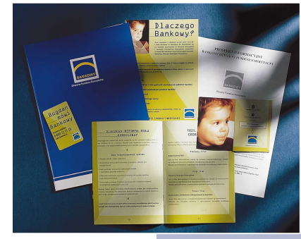
Bank Handlony przygotował szeroką ofertę w związku z rozpoczynającą się w 1999 r. reformą ubezpieczeń społecznych