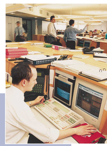
Bank aktywnie uczestniczył w operacjach rynku pieniężnego

Na rynku depozytów międzybankowych dzienne obroty Banku Handlowego – jak i całego rynku – znacznie się zwiększyły i wynosiły 400 mln zł - 600 mln zł wobec 100 mln zł - 450 mln zł w roku poprzednim.