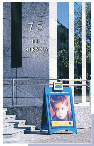
Utworzenie 27 października 1998 r. wspólnie z PKO BP spółki PKO / Handlowy Powszechne Towarzystwo Emerytalne SA zapoczątkowało aktywne uczestnictwo Banku w polskiej reformie emerytalnej

Otwarty Fundusz Inwestycyjny "Kapitał – Handlowy Senior" jest jednym z pięciu utworzonych w 1998 r. otwartych funduszy obsługiwanych przez Towarzystwo Funduszy Inwestycyjnych Banku Handlowego SA, Kapitał – Handlowy. Cztery pozostałe to otwarte fundusze inwestycyjne dla osób prywatnych, zróżnicowane pod względem poziomu podejmowanego ryzyka. Klientom Towarzystwa proponuje się również celowe plany oszczędnościowe – Pewne Jutro, Dziecko i Skarbonka.